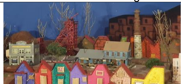
Casas humildes de los mineros