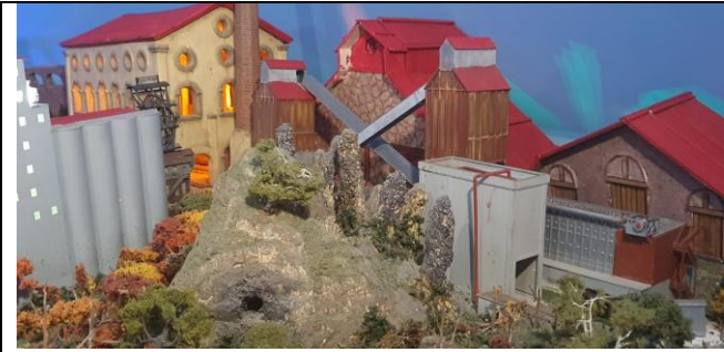
El Real del Monte lleno de chimeneas