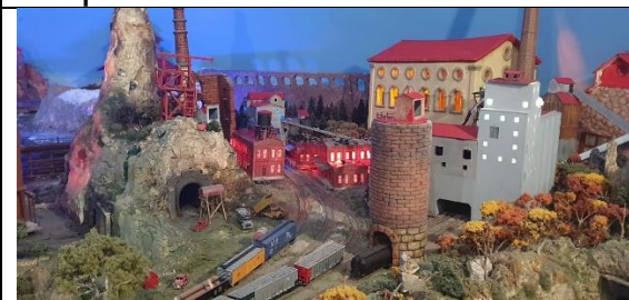
La minería en terrenos complicados