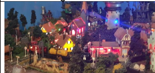
Un pueblo en las alturas