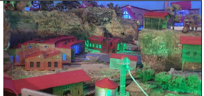
Vestigios mineros por todos lados