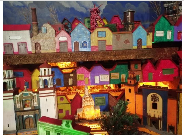
En su entrañas minas