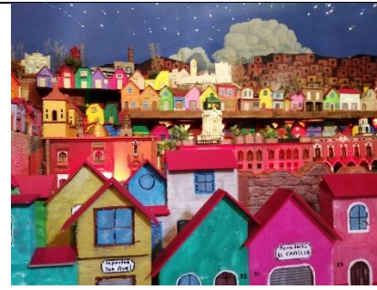
Colorido de la ciudad