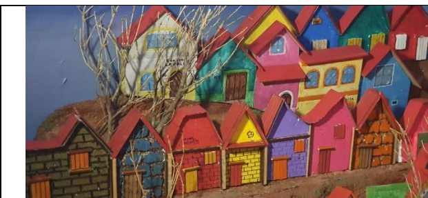
Barrios altos de Pachuca