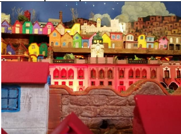
Rodeada de cerros