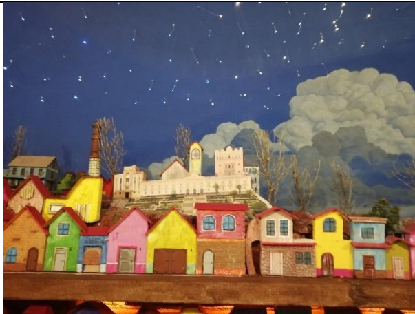
Entre calles y casas minas