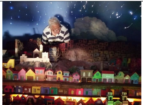
Por ese cerro la UAEH