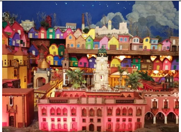
Edificios señoriales en el centro