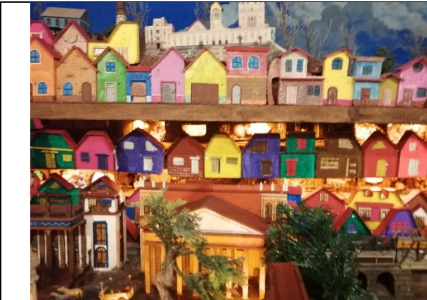
Viviendas de mineros