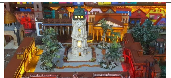
Majestuosos reloj monumental