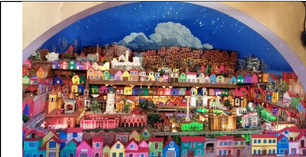
La pachuquita del museo